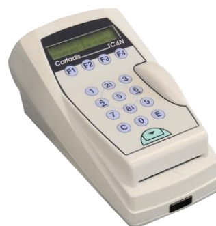
Lecteurs de cartes magnétiques TC4N/TC11N/TCRS

Il permet la distribution de cartes magnétiques Cartadis jetables en carton et chargées (réf. WCPAP-PROG).